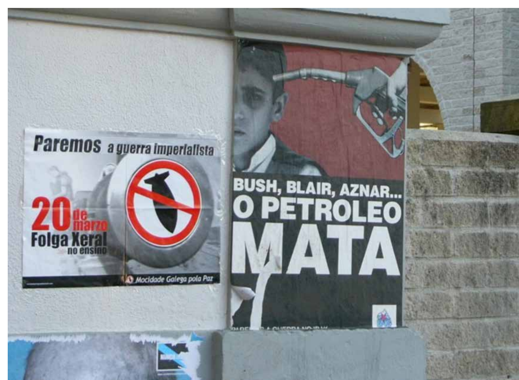
Cartaz producido polo movemento Nunca Máis, 2003.