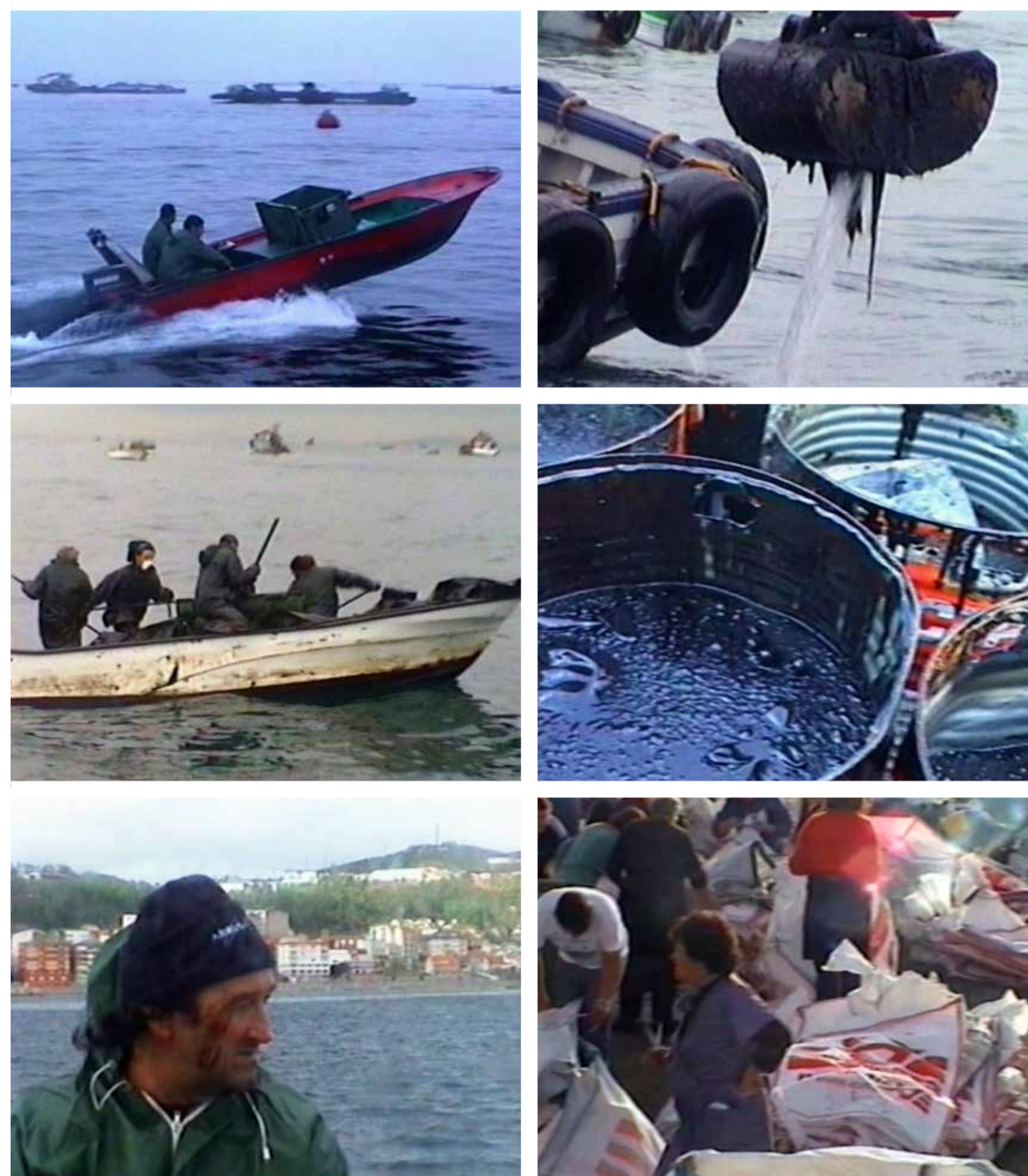
Imaxes do documental 'Unha Gran Burla Negra', 2018.