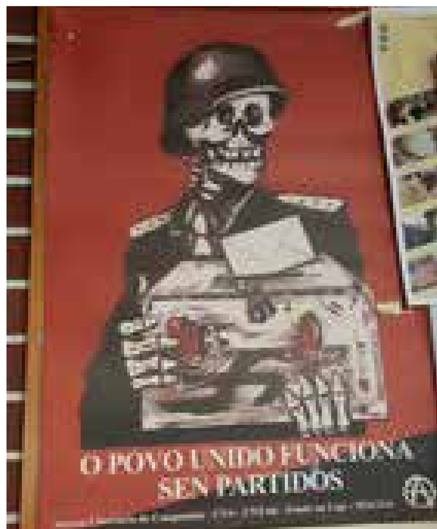
Cartaz fotografado no Bar Castelo, Rianxo, en marzo de 2009.

Mediante correos, foros e páxinas como www.miniaturegigantic.com , www.proteststposters.org , e www.designation.com , organizouse un poderoso movemento de rexeitamento contra a campaña da guerra de Iraq mediante unha gráfica política vibrante e novidosa. Neste empeño global participaron artistas e activistas do estado español, e así foi recollido en compilacións como Carteles contra una guerra . Signos por la Paz . Como xa fixera o movemento altermundialista, as novas tecnoloxías de comunicación e o deseño dixital ofrecían unha resposta disruptiva fronte á capacidade de propaganda dos medios de comunicación. A acción difusa de milleiros de persoas anónimas rompeu co monopolio comunicativo corporativo desvelando as tramas de intereses ás que este servía. A gráfica política do Nunca Máis non é allea a este movemento, que adapta ás súas necesidades propias na loita contra o fuel.