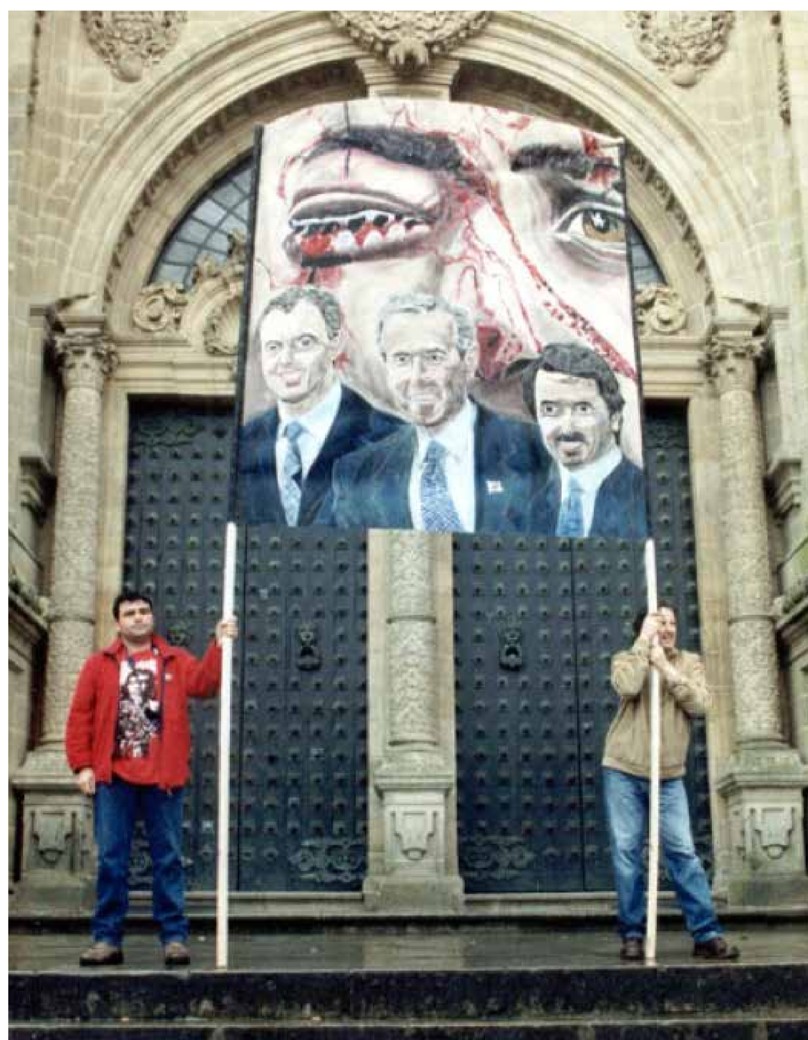
Manifestación en Santiago portando as pancartas do colectivo das Redes Escarlata, 2003.