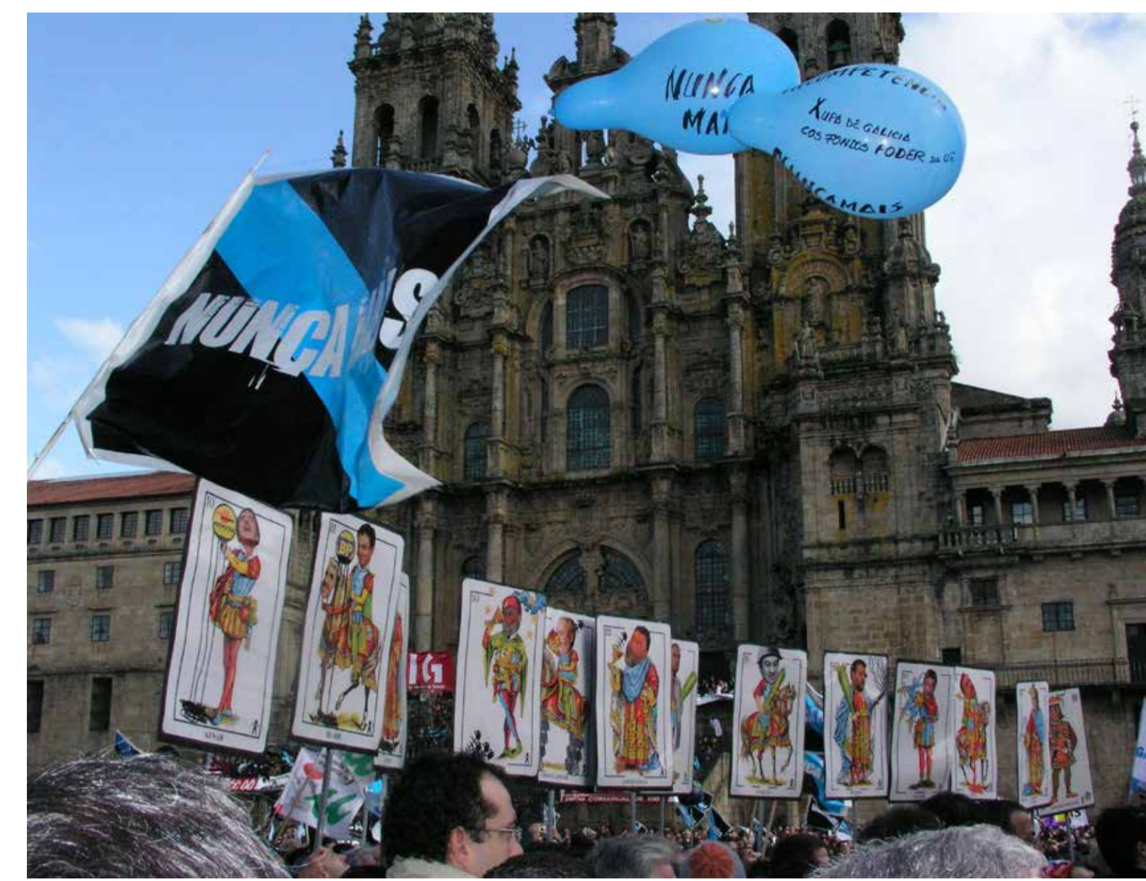
A Baralla do Prestige nas protestas cidadás, 2003.