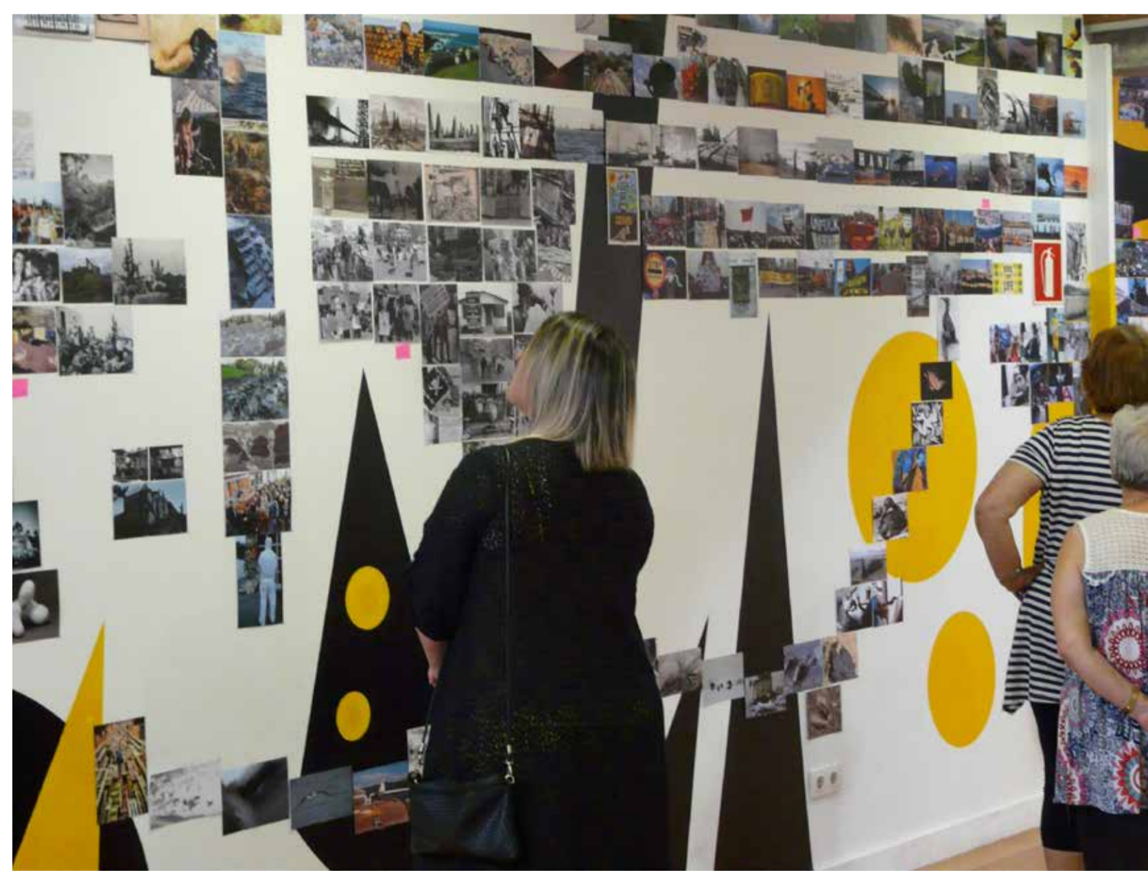
Exposición 'Un Nunca Máis contado polas fillas de Man', 2019, Museo Manfred de Camelle.