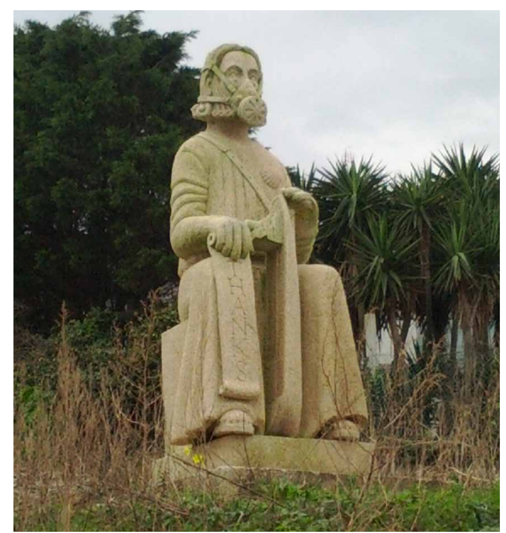
Apostolo voluntario. Escultura Juan Cabeza.