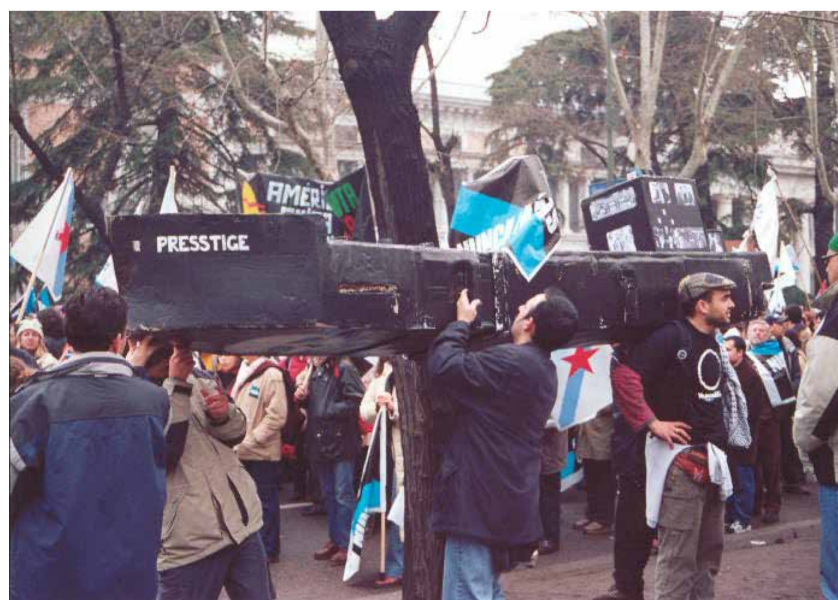
Manifestación en Madrid, 23 de febreiro de 2003.

Na grande manifestación do 23 de febreiro do 2003 acudiu un camión faranduleiro cun sistema musical aparatoso. Viña recuberto polos relevos do Prestige representados na súa última fase, cando xa tronzara e estaba para afundir. Era unha sorte de barco fantasma, convocado nun límite entre a festa e a morte e nunhas datas antroidais. No día en que se conmemora o golpe de estado de Tejero, queríase ocupar co espectro do petróleo a capital madrileña, nun exercicio de reapropiación festiva da «doutrina do shock», anos antes de que o 15M falase do «23-F dos Mercados». Naquel febreiro do 2003, o barco afundido retornaba como pesadelo lúdico, como figura carnavalesca. Pero a visión que ofrecían dese barco afundido era inédita. Ao refaceren a silueta, aqueles artistas reconstruíron coa arte unha perspectiva que os medios de comunicación non nos fixeron ver.