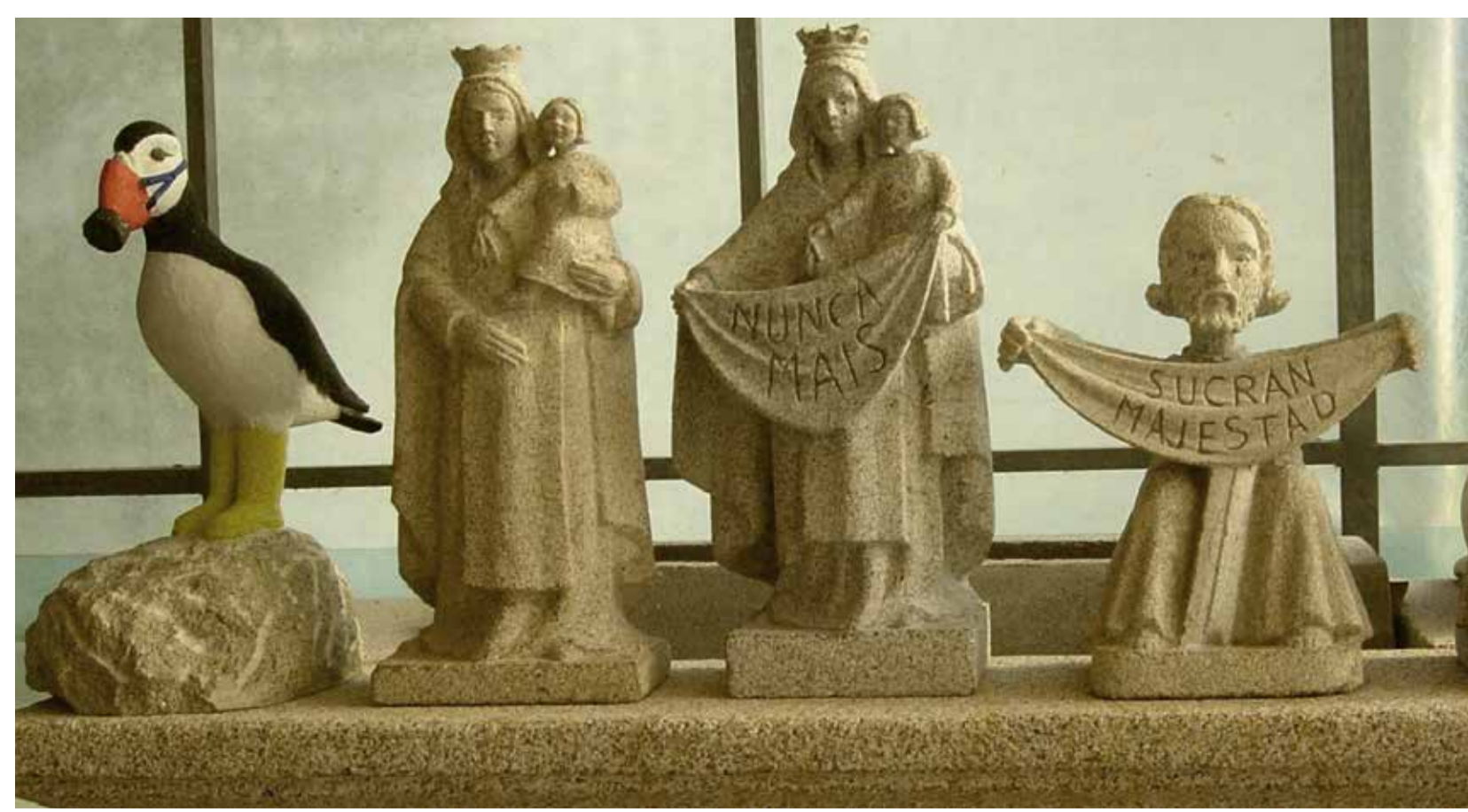
Xogo de esculturas de Juan Cabeza.