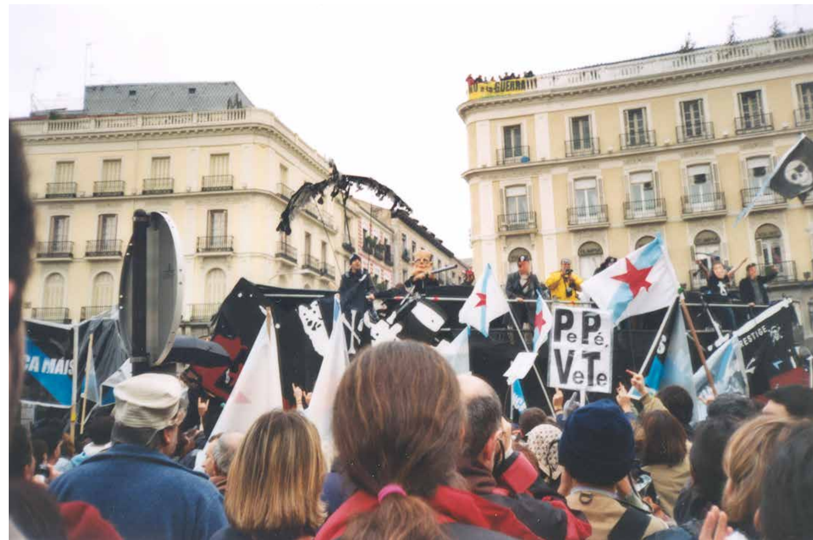
Xunto ao palco na Puerta del Sol en Madrid na manifestación do 23 de febreiro de 2003. Arquivo Vivo AUGBN.