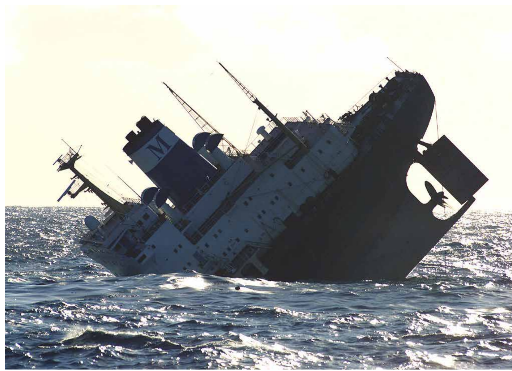
Imaxe anónima do afundimento.

Para o ollo cenital o mundo é demasiado pequeno como para ver o que nel pasa. A ese ollar de satélite só lle interesan as catástrofes cando son grandes abondo, pero nada sabe da súa escala respecto dos corpos que as viven. O afundimento do Prestige narrouse desde un helicóptero ou a través das fotografías épicas de Xurxo Lobato, que fixeron del a boca dun tiburón. Porén, daquela faltáronnos as perspectivas. Non vimos a altura desproporcionada da nave respecto dun corpo humano. Non vimos o óxido. E, sobre todo, non vimos o furado xigante nun costado, o baleiro polo que xa saíran cantidades descomunais de chapapote. Ver a catástrofe desde arriba é algo con consecuencias. A perspectiva que un adopta é a primeira cuestión estética e política. Daquela había outros puntos de vista dispoñibles que non circularon. Son moitas as imaxes inéditas do afundimento do navío aínda hoxe pendentas. As que aquí recuperamos presentan a lenta agonía da nave, a súa velez vulnerable, a súa condición póstuma. Permitennos ver barco non como o depredador e si como a presa.