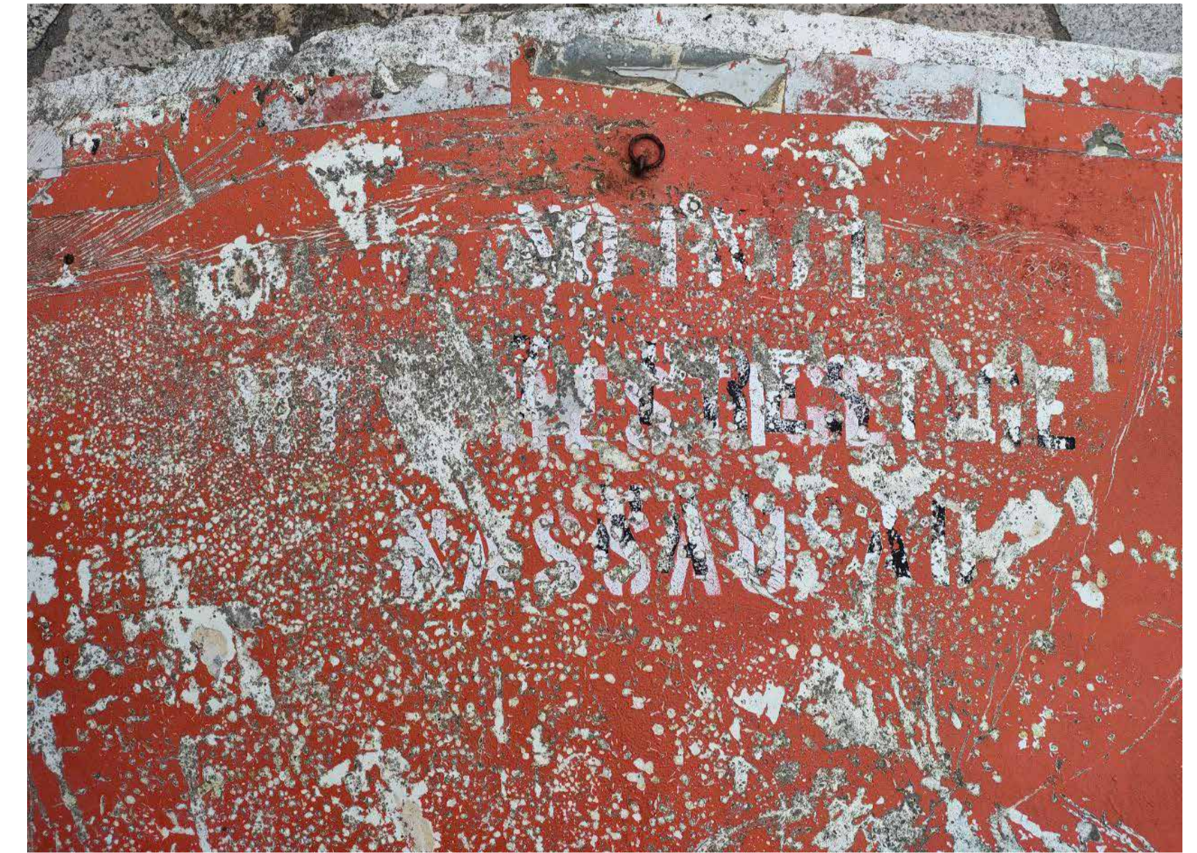
Pecio dun bote salvavidas do Prestige.